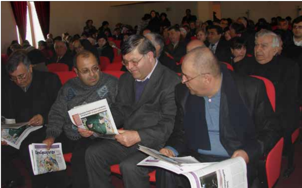
Գիտաժողովը տեղի ունեցավ Համո Սահյանի անունը կրող մշակույթի կենտրոնում, որի լեհ-լեցուն դահլիճը մութ երեք ժամ համակ ուշադրությամբ ունկնդրեց ներկայացվող ելույթները:

տի, քաղաքացու, մարդու եւ մտավորականի կերտման գործում: Առաջին ստորագրությունը պատկանում է ազգային բարերար Ալեքսանդր Մանթաշյանին, որը կյանքի ու գիտության ճանապարհացույց եղավ երիտասարդ Արոնցի համար: 1891թ. Արոնցը հեռացավ Սբ Էջմիածնի Գեորգյան ճեմարանի լսարանական երրորդ կուրսից՝ ուսումնառությունը թիֆլիսի ռուսական գիմնազիայում շարունակելու մտադրությամբ, որը նրան հնարավորություն կտար ուսումնառություն ստանալ Եվրոպական որեւէ համալսարանում: 1894թ. Արոնցն ավարտում է թիֆլիսի ռուսական 2-րդ դասական գիմնազիան եւ անմիջապես դիմում է ներկայացնում Ալ.Մանթաշյանին՝ իր հետագա ուսումնառությունը թռչակավորելու խնդրանքով: Ծանոթանալով դիմումին՝ Մանթաշյանը ցանկացել է անձամբ տեսնել Արոնցին, որի անառողջ, չափազանց միհար ֆիզիկական կերպարը որեւէ դրական ազդեցություն չթողեց բարերարի վրա: Մանթաշյանը չէր կողմնորոշվում ստորագրել նրա դիմումնագիրը, թե ոչ: Անպաճույճ գրույցը երիտասարդի հետ, որը վերաբերում էր հայոց կյանքին այդ ժամանակ հետաքրքրող հարցերին, միանգամից ուղղորդեց Մանթաշյանին, որը հուճորով նկատեց: - Նիկողայոս, դու համարյա արդեն կես համալսարանի չափ գիտելիք ունես, կմնա մյուս կեսը յուրացնել, -եւ ստորագրեց դիմումնագրի ներքո: «Համարել սան եւ նշանակել թռչակ»: Ալ.Մանթաշյանի նշանակած թռչակով Ն.Արոնցը 1894 թվականից սովորել է Դորպատի (Տարտու) եւ