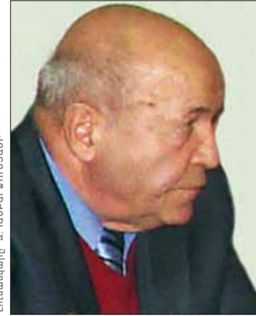
ՌՈՒՆՆՈՒ ԱՂՈՆՑ Նիկողայոս Աղոնցի ազգակից

Մատմությունն իր ամենակարող ձեռքով սրբազրում, իր տեղն է դնում ամեն ինչ, ճշտում նաեւ մեծագույն ամհատականությունների տեղն ու դերը ժամանակի ու հավերժության մեջ: Եվ ուրեմն՝ Նիկողայոս Աղոնցը ոչ միայն իր ժամանակին է պատկանում, այլեւ՝ ապագային, նա, հիրավի, հավերժության ուղեկիցն է: Յուրաքանչյուրիս պարտքն է ներկա եւ գալիք սերունդների մեջ մշտապես վառ պահել Նիկողայոս Աղոնցի վեհ անունը, ուսումնասիրել, հետազոտել այն հսկայածավալ գիտական ժառանգությունը, որ թողել է ինքը: Ներկա գիտաժողովը հենց այդ նպատակն է հետապնդում: Հավատացած եմ, որ Նիկողայոս Աղոնցի գիտական ժառանգությանը հաղորդակից լինելու այլ միջոցառումներ եւս կկազմակերպվեն՝ եւ ոչ միայն Սյունիքում: Գիտաժողովը՝ նվիրված պատմաբան, հայագետ, բյուզանդագետ եւ մեծ հայրենասեր Նիկողայոս Աղոնցին, հայտարարում եմ բացված: